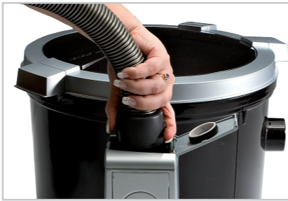
Der Duo kann auch nur mit einer Saugdose direkt am Gerät betrieben werden.